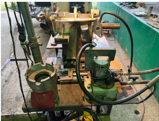
くまどー第1リフト握索機オーバーホール風景